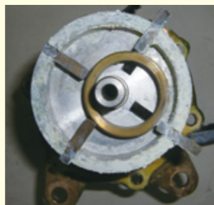
真空ポンプ ベーン固着による 作動不良及び吸水不能