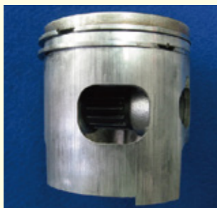
オイル不良 ピストンの異常磨耗 (全周に縦キズあり)