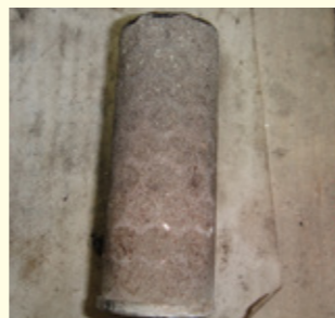
真空ポンプストレーナー ゴミ詰まりによる吸水不能